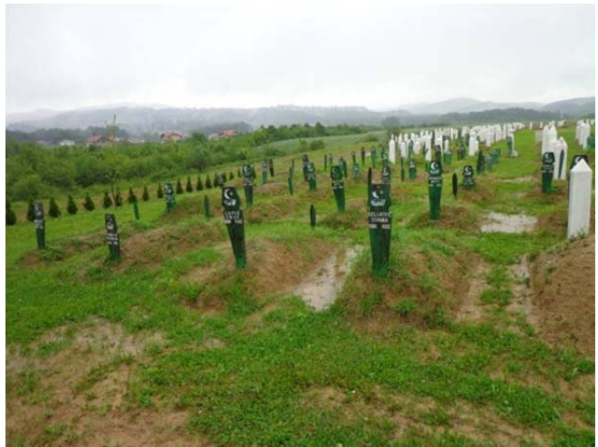
Een begraafplaats in Kalesija met gevallen uit de burgeroorlog (1992-1995).