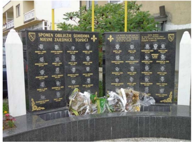
Een monument in Tojsici voor de gevallen in de Bosnische burgeroorlog