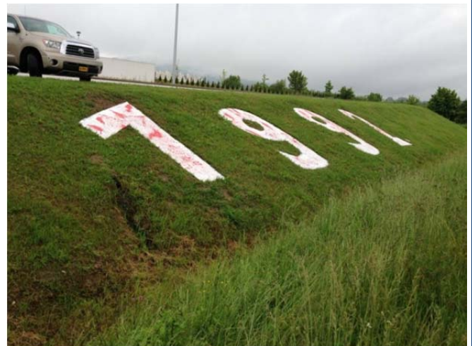
De burgeroorlog is overal aanwezig