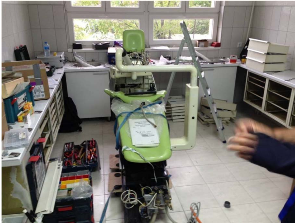
De tandartsstoel uit Maas en Waal in het ziekenhuis van Kalesija.