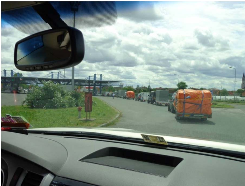
De colonne fourwheeldrives met aanhangers uit de Betuwe en Maas en Waal, wachtend voor de Kroatische-Bosnische grens.