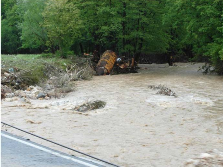
Schade na het hoogwater