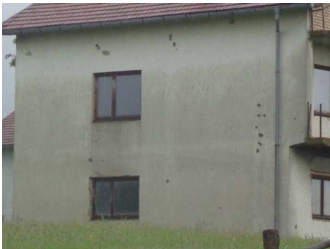
Kogelgaten in de muren van de huizen langs de weg.