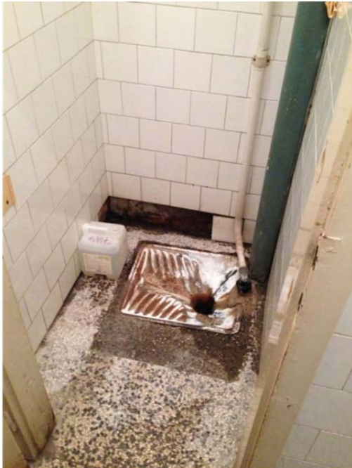
Het toilet in het ziekenhuis van Kalesija